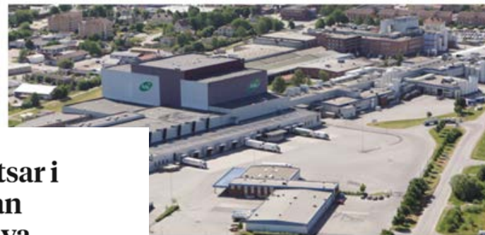
Arla investerar 95 miljoner i Götene

När Arla investera 95 miljoner kronor i mejeriet i Götene. Bäst för att säkra smör- och matfettproduktionen genom att öka effektiviteten och kapaciteten.