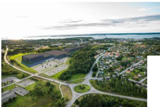
Så här planerar Metsä Tissue att expandera vid Katrinefors bruk.

Metsä Tissues miljardsatsning i Mariestad har varit stor snackis sedan planerna offentliggjordes i höst. Lovord har blandats med oroliga röster för hur utbyggnaden kommer att påverka närboende och naturen.