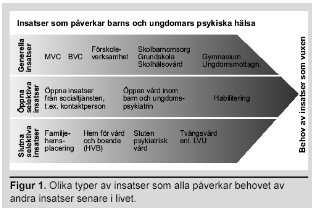
Bild 2 beskriver olika samhällsnivåer, strukturer för stödet till barnet, hämtad från Socialstyrelsens rapport "Tänk långsiktig" (Soc st 2004)

I rapporten "Tänk långsiktig" som vill stimulera huvudmännen att satsa förebyggande, tänka långsiktigt och samverka, jämförs kostnaden för generella insatser för barn och ungdom med kostnaden för selektiva insatser för psykisk ohälsa hos vuxna. Under 1990-talets krisår blev barngrupperna inom förskola och skolklasser större. Samtidigt ökade trycket på socialtjänstens IFO och på BUP. Det är rimligt att anta att det finns ett samband. Tidiga satsningar för barn kan ses som sociala investeringar i befolkningens hälsa. Det problematiska är att kopplingen mellan en insats och dess hälsoeffekter inte alltid är klar. Vilka insatser leder till vilka effekter? Rapporten lyfter fram att det finns kunskap om olika riskfaktorer för psykisk ohälsa men att det är svårt att förutse vilka barn som kommer att få problem. Därför är det viktigt att satsa på bra generella insatser som når alla barn. Om man väljer att satsa på generella insatser kan man inte direkt också minska de selektiva insatserna men det är rimligt att tro att behoven av dessa kan minska på sikt. Värdet av tidiga generella insatser beskrivs i ett långsiktigt, sektorsövergripande och samhällsekonomiskt perspektiv.