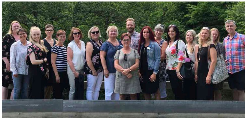
I april 2018 träffades projektets "pilotsyvar" i Uddevalla för en dag med erfarenhetsutbyte.

Projektet "Vägledning för livet" syftar till utveckling av studie- och yrkesvägledning som är en aktuell och viktig fråga. Projektet finansieras av Europeiska socialfonden och drivs som ett samarbete mellan kommunalförbunden i Skaraborg, Fyrbodal och Sjuhärad Boråsregionen.