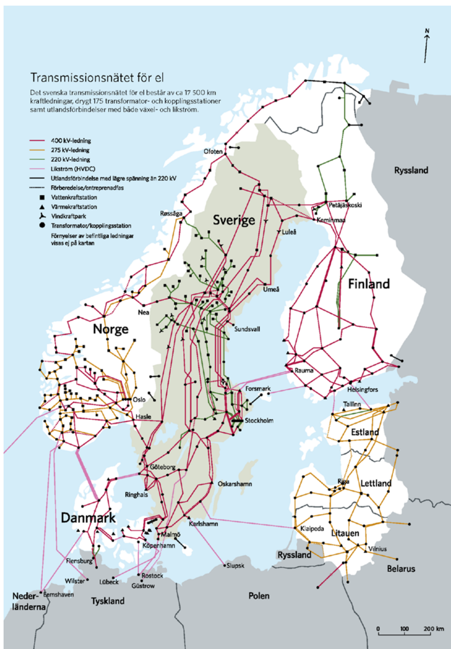
Illustration från Svenska Kraftnät

Transmissionsnätet: det storskaliga nätet som kopplar ihop hela Sverige, från norr till söder. Det finns ett enda, och det är det statlig ägda Svenska Kraftnät som äger och driver nätet.